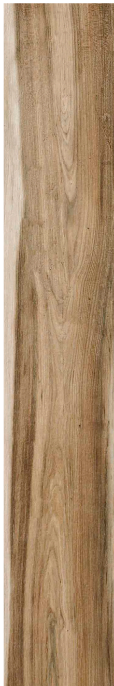
23 x 120 cm (9 x 48) UN.SB.NAT.0948