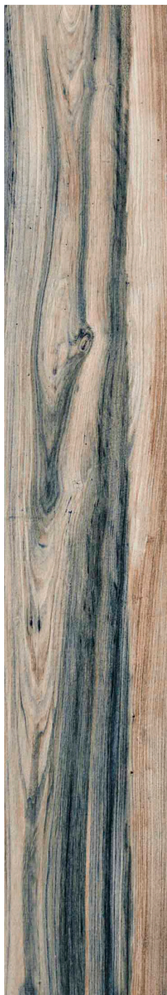
23 x 120 cm (9 x 48) UN.SB.CIE.0948