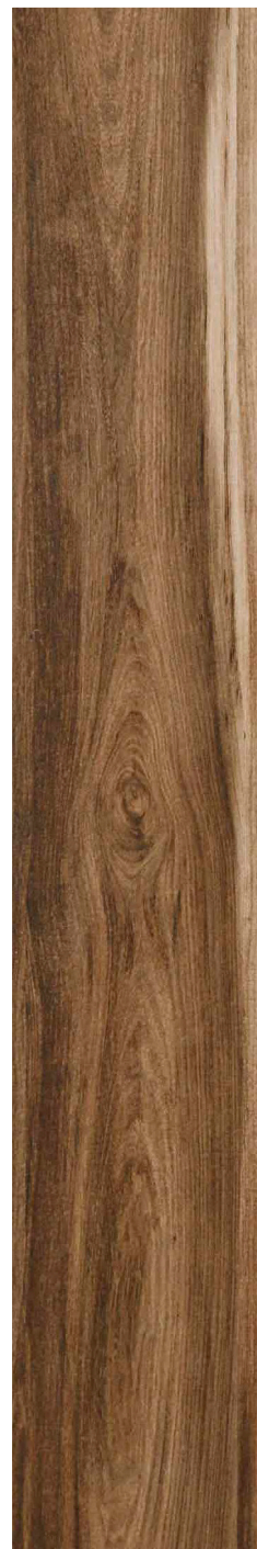
23 x 120 cm (9 x 48) UN.SB.TAB.0948

Tous les items présentés dans ce document font partie du programme d'inventaire Olympia. Pour les commandes spéciales, veuillez contacter votre représentant de Tuiles Olympia.