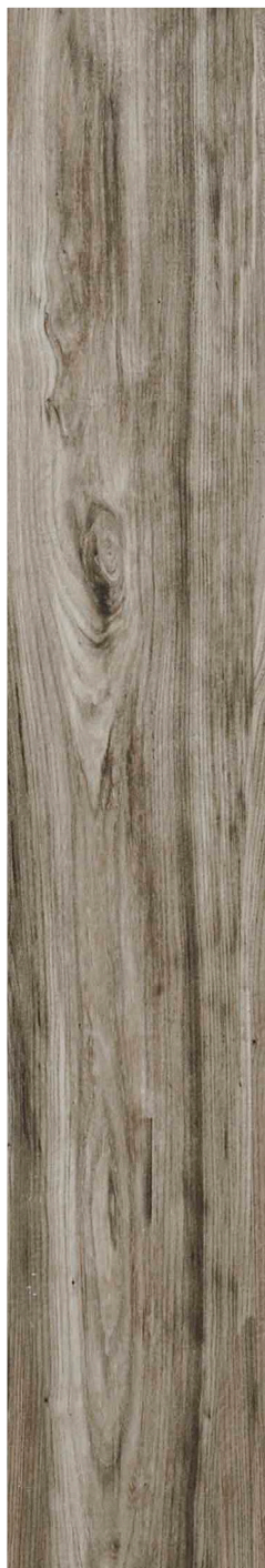
23 x 120 cm (9 x 48) UN.SB.GRS.0948